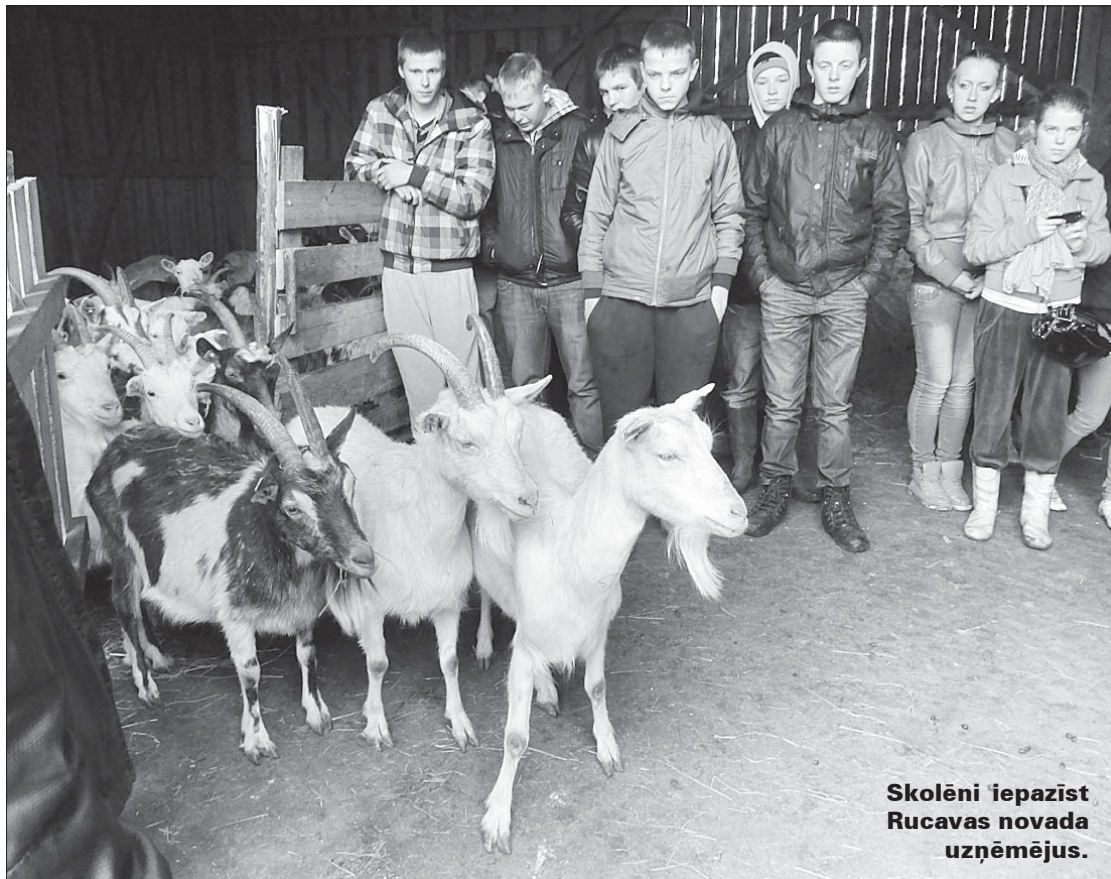
Skolēni iepazīst Rucavas novada uzņēmējus.

Izvēlēties profesiju ir ļoti grūts process. Bieži ir tā, ka nodarbošanās, kas likusies interesanta, beigu beigās nemaz nepatīk, un otrādi, amats, kurš nemaz nešķiet interesants, izpētot un atklājot to no cita rakursa, izrādās interesants un aizraujošs. Ir svarīgi apzināties lietas, kuras patīk un kuras varētu darīt daudz gadu garumā, tāpat kā lietas, kuras nepatīk. Tāpat svarīgi ir apzināt darba iespējas dzīvesvietai vai tās tuvumā.