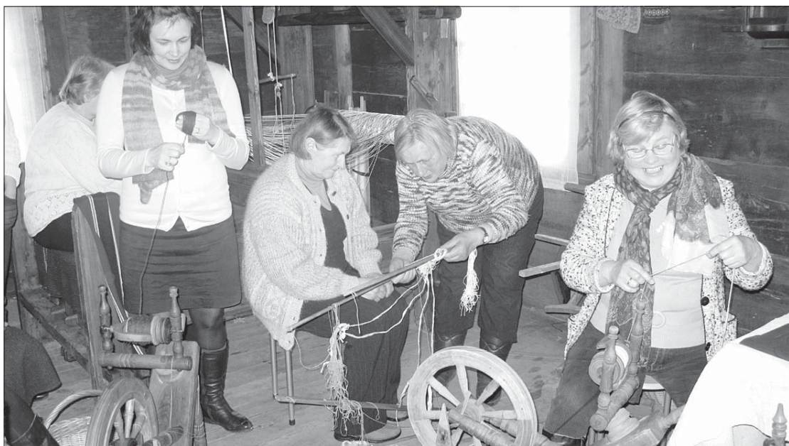
"Zvanītāju" istuba pilla sievu un ratinu, darbam gatavas tītavas, lanktis un stakles.

Ziņas par rucavnieču glabātajiem bagātiem pūriem un kopānākšanu, lai godā celtu vecsmātes mākas un gudrības, tālu aizgājušas – suitīnes arī gribot mācīties Rucavas sievu dzīves, ķeķes un rokdarbu gudrības, īpaši islavētās jakas, talab sestdienu, 2. martā, atbraukušas viesos.