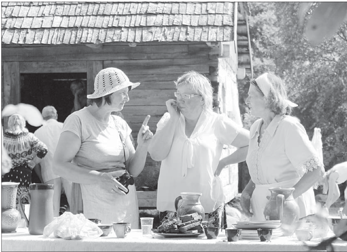
Bija iespēja arī satikties un apmainīties ar zināšanām un pieredzi.

Ari zem ābelēm jau čum un mudž no sievām – galdā tiek liktas tortes, griezti sieri, lai var noņemt provi un pēdis noteikt labāko, gardāko. Katram sieram tiek piešķirts kārtas numurs, lai tad, kad siers noprovēts, var