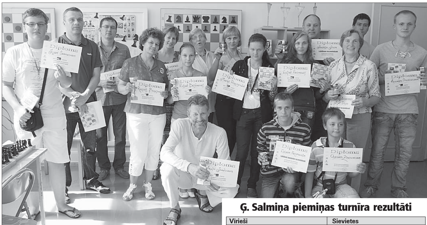
Turnīra dalībnieki pēc apbalvošanas.