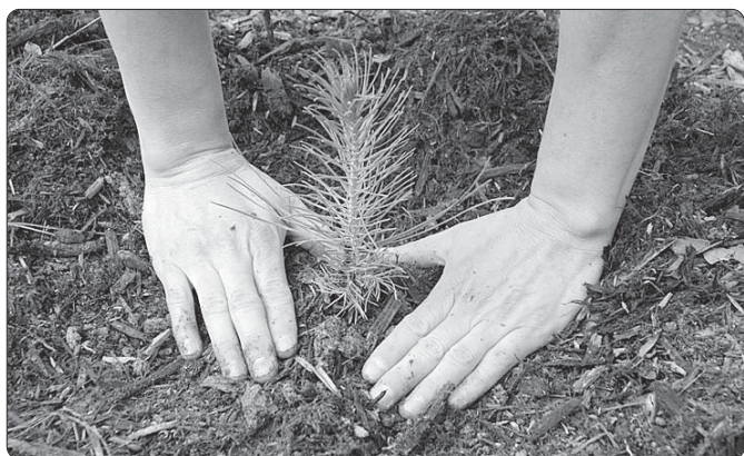
Maijā pašvaldības īpašumā iestādīja 2,2 h mežu.

Par konkrētu laiku un vietu informēsim atsevišķi.