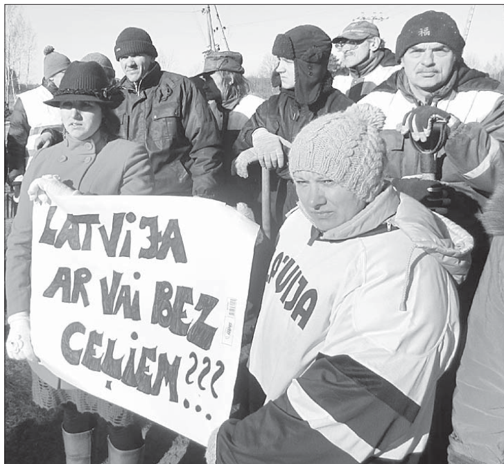
Autoceļa A11 tehniskais stāvoklis ietekmē ne tikai Rucavas novada iedzīvotājus. Pasākumā piedalījās arī Klaipēdas pilsētas domes deputāti. Bruņojušies ar plakātiem un nepieciešamajiem rīkiem un tehniku bedru aiztaisīšanai, vairāk nekā simt cilvēku – gan rucavnieki un apkāmes iedzīvotāji, gan lietuvieši, kurus uztrauc autoceļa sliktais stāvoklis, – piedalījās simboliskajā bedru lāpīšanā pie Lietuvas robežas.

Pēc simboliskas talkas, kurā cilvēki ne tikai ar lāpstām, bet pat ar smago tehniku imitēja bedru lāpīšanu, tās dalībnieki Latvijas autoceļus izvadīja nosacītā pēdējā gaitā. Protesta akciju uzmanīja Valsts policija.