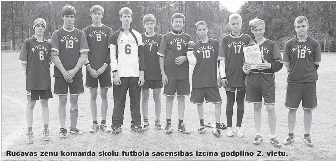
Rucavas zēnu komanda skolu futbola sacensībās izcīna godpilno 2. vietu.