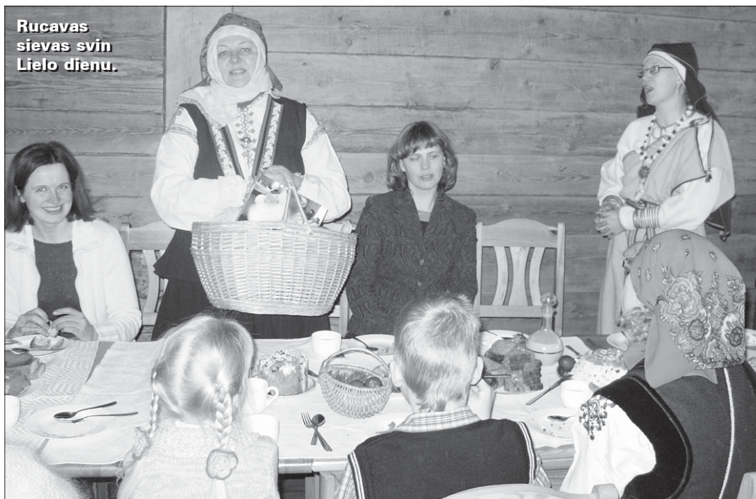
Rucavas sievas svin Lielo dienu.