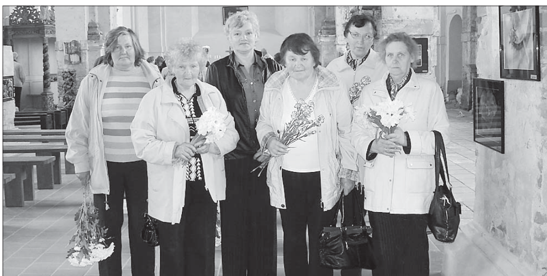
Dunikas pagasta delegācija Otrā pasaules kara laikā latviešu leģiona rindās kritušo karavīru piemiņas vietā Lestenē.

Arī mēs, Dunikas pagasta delegācija, piedalījāmies šajā grandiozajā pasākumā: aiz-