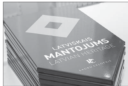
Zīme "Latviskais mantojums" turpmāk rotās "Zvanītāju" māju.

Kā vieni no pirmajiem divpadsmit kultūras zīmi "Latviskais mantojums" ar "Lauku ceļotāja" ieteikumu un ar komisijas vien-