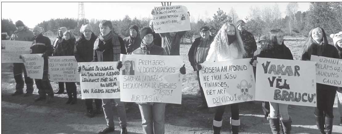
Lai pievērstu uzmanību valsts galvenā autoceļa A11 Liepāja – Lietuvas robeža (Rucava) dramatiskajam tehniskajam stāvoklim, kā arī ceļu stāvoklim Latvijā kopumā, 2013. gada 12. martā Rucavas novada pašvaldība rīkoja protesta akciju, kuru atbalstīja uzņēmēji, aktīvākie iedzīvotāji, Nicas novada pašvaldība, Rīgas Tehniskās universitātes studenti u.c.