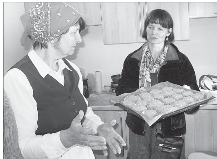
Gatavi suitu rauŗi – apakŗā rāciņu kārta ar ķemelēm, pa virsu burķāni ar saldu kreimu un cukuru.