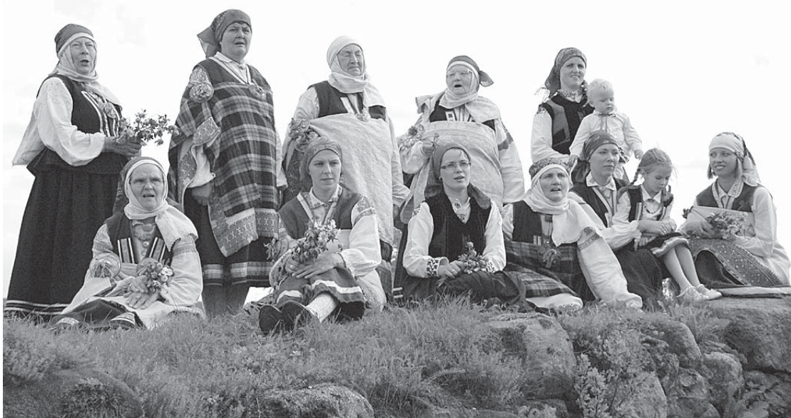
Senās latvietības dzīvais muzejs – savās ceļojuma piezīmēs "Uz tām prūšu robežām" Rucavas novadu raksturojis Emīls Melngailis.

2013. gada 6. aprīlī pulksten 11 Rucavas Kultūras namā notiks konference "Rucava iz senatnes". Tās sākumā tiks atklāta izstāde "Rucava iz senatnes". Konferenci un izstādi atklās Rucavas novada domes priekšsēdētāja Līga Stendze un goda viesi Latvijas valsts prezidente (1999–2007) Vaira Vīķe-Freiberga un profesors Imants Freibergs.