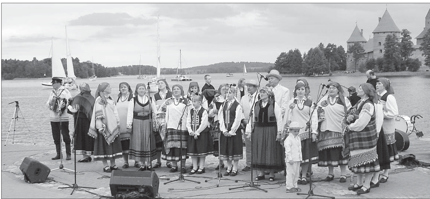
Rucavas etnogrāfiskais ansamblis un lauku kapela "Paurupīte" uzstājas starptautiskā festivālā Traķos Lietuvā.