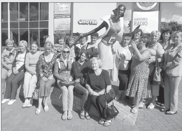
23. augustā Rucavas novada iedzīvotāji devās ekskursijā uz Tukumu.