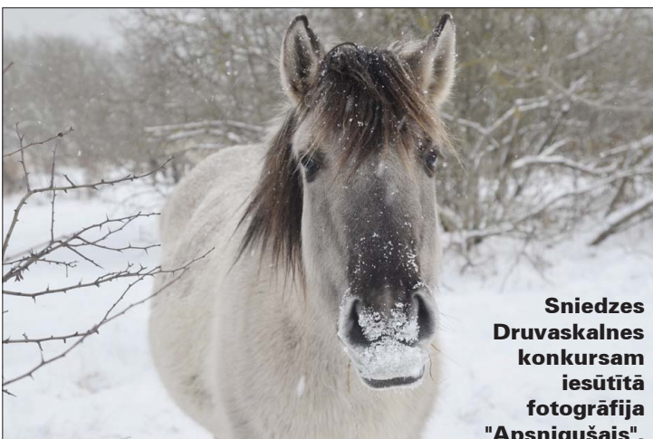
Sniedzes Druvaskalnes konkursam iesūtītā fotogrāfija "Apsnigušais".