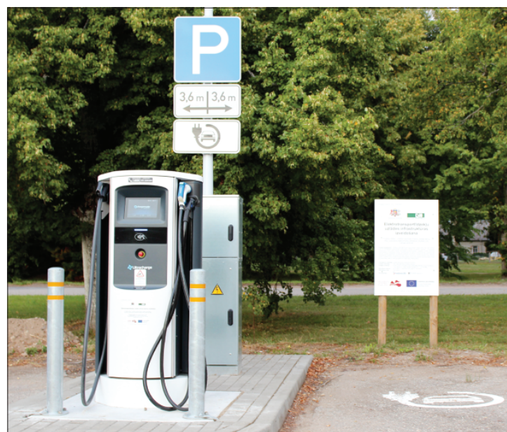
Rucavas tirgus laukumā darbojas elektromobiļu ātrās uzlādes punkts.

uzlādes staciju tīkla izveides turpinās, un līdz 2021. gadam