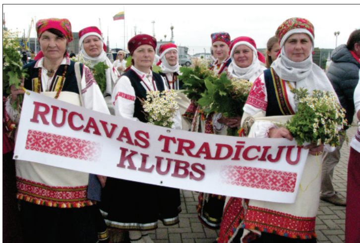
Rucavas tradīciju klubs pārstāv Kurzemi Klaipēdā.

Vareni Lietuva svinēja savus valsts izveidošanas svētkus – šogad apritēja 765 gadi kopš Lietuvas karaļa Mindauga kronēšanas. Arī Klaipēdā bija svētki – ar koncertiem, sporta spēlēm, ar gājieni, kurā piedalījās cieņi no dažādām valstīm, tai skaitā Latvijas. Latviju pārstāvēja koris no Ropažiem, deju kolektīvs no Madonas un Rucavas tradīciju klubs. Rucavas sievas ar