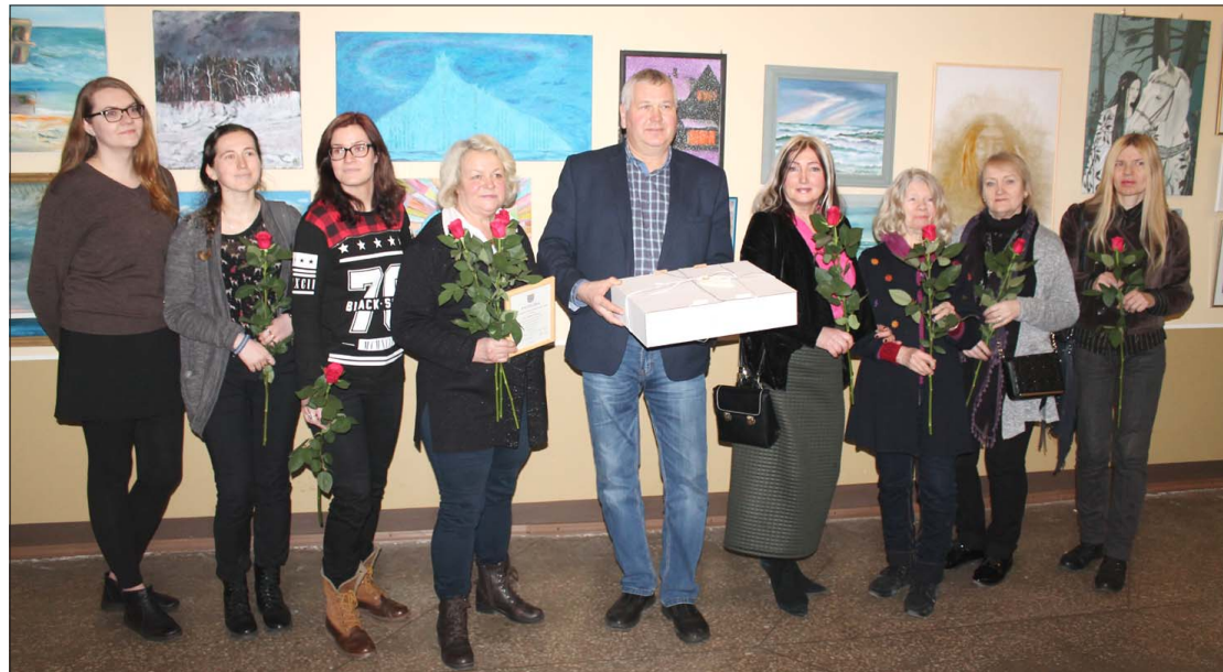
Izstādes "Pūt, vējiņi, Rucavā" atklāšana 10. janvārī Rucavas kultūras namā.