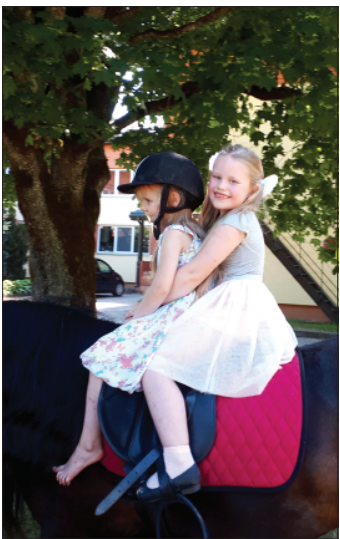
Ballē bērnus sajūsmināja divi zirdziņi, ar kuriem viņi varēja doties izjādē.