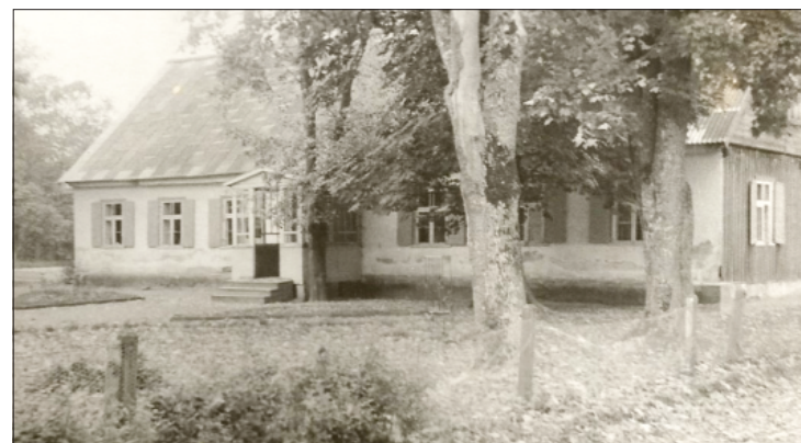
Meklē fotogrāfiju, kurā Rucavas bērnudārzam redzams vecais dakstiņu jumts.

Paldies visiem, kas ir atsaucīgi ziņu sniegšanā un fotogrāfiju