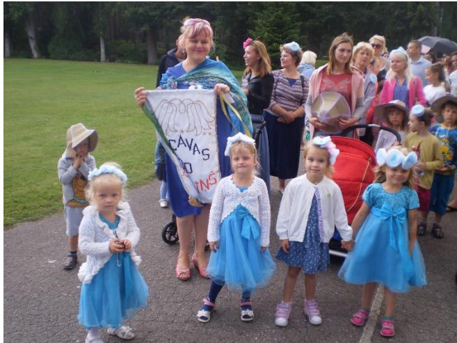
Rucavas novada pirmsskolas izglītības iestādes "Zvaniņš" pašnovērtējuma ziņojums, 2018